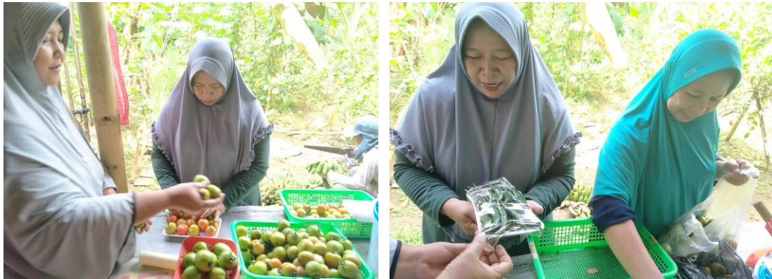
Gambar 4. Penanganan Pasca Panen (Pengemasan)

bibit di kebun bibit, bersama-sama melakukan penanaman di lahan pertanaman (demplot) juga di pekarangan/halaman rumah masing-masing.