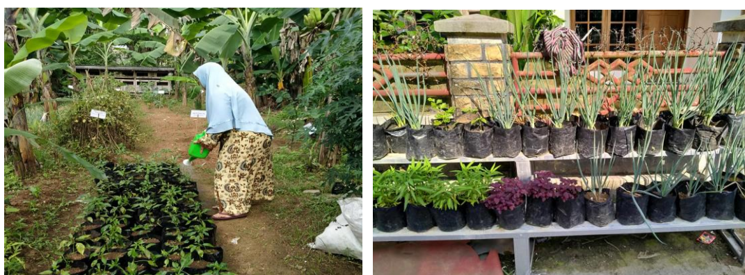
Gambar 3. Pertanaman P2L di Lahan dan Di Pekarangan Rumah

Tanaman yang diusahakan pada program P2L ini sebagian besar adalah tanaman hortikultura untuk memenuhi kebutuhan sehari-hari seperti: tomat, bawang daun, cabe, rawit, saledri, pakcoy dan terong. Masing-masing anggota kelompok akan mendapatkan 75 polibag tanaman gabungan dari berbagai jenis tanaman yang telah disiapkan untuk ditanam di pekarangan atau halaman rumah masing-masing, sebagaimana terlihat pada Gambar 3.