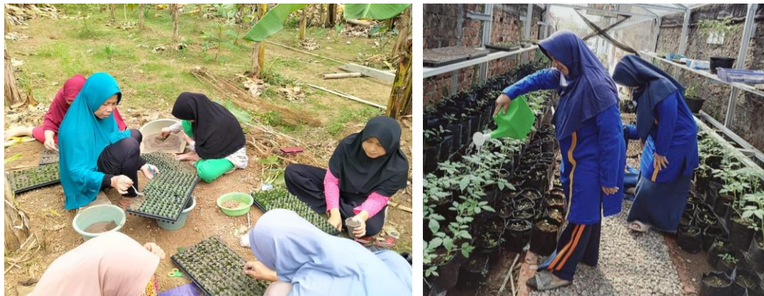
Gambar 2. Persiapan bibit dan Pembibitan di Kebun Bibit

Secara umum kegiatan dalam pelaksanaan P2L di KWT Walidah meliputi: (1) persemaian /penyiapan bibit; (2) pembuatan kebun bibit; (3) pembuatan media tanam, (4) penanaman, (6) pemeliharaan (7) panen dan pasca panen dan (8) pemasaran. Lebih jelasnya pelaksanaan tersebut beberapa diantaranya ditampilkan dalam dokumentasi berikut: